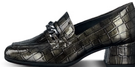
24365-29-733 WIDTH H | RECYCLED P.E.T.