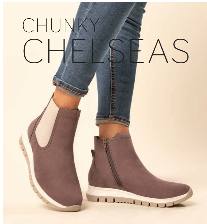
25469-29-588 WIDTH H | RECYCLED P.E.T.