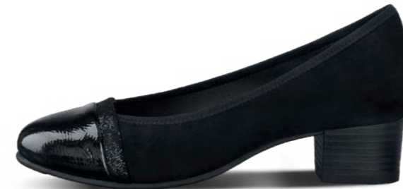
22366-29-001 WIDTH H | RECYCLED P.E.T.