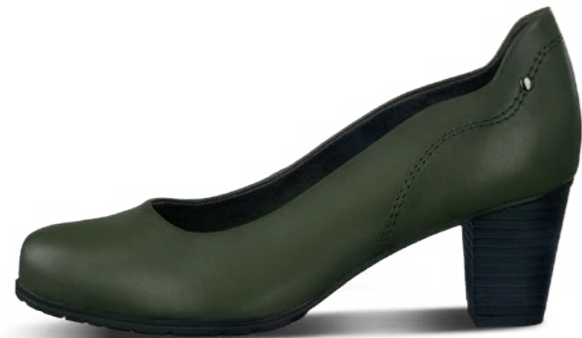
22462-29-707 WIDTH H | RECYCLED P.E.T.