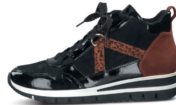
25267-29-001 WIDTH H | RECYCLED P.E.T.