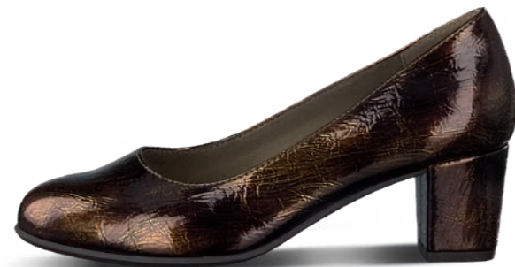
22469-29-994 WIDTH H | RECYCLED P.E.T.