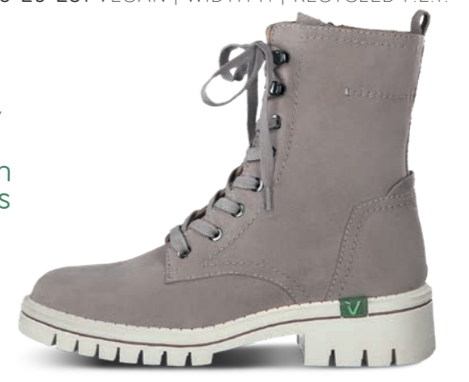
25281-29-204 VEGAN | WIDTH H | RECYCLED P.E.T.