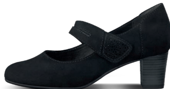
24463-29-001 WIDTH H | RECYCLED P.E.T.