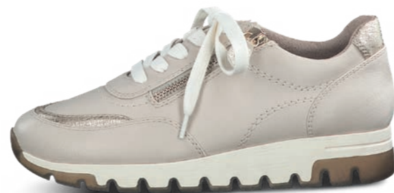
23768-29-411 WIDTH H | RECYCLED P.E.T.