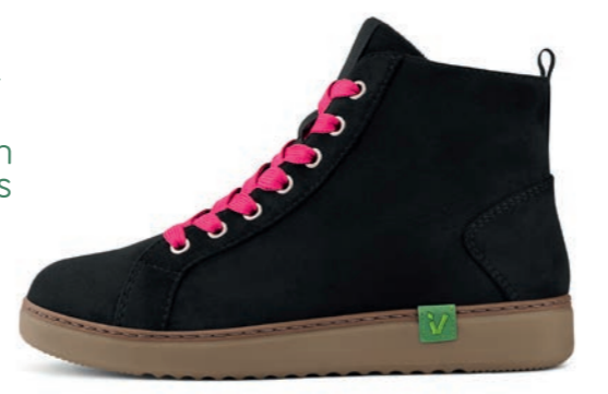
25280-29-059 VEGAN | WIDTH H | RECYCLED P.E.T.