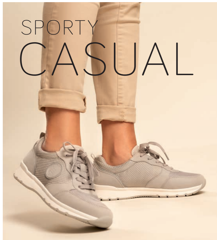
23664-29-200 WIDTH H | RECYCLED P.E.T.