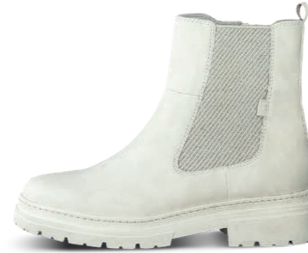
25466-29-411 WIDTH H | RECYCLED P.E.T.