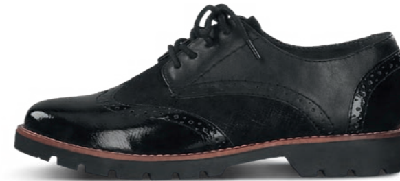
23760-29-008 WIDTH H | RECYCLED P.E.T.