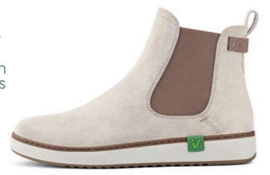
25480-29-433 VEGAN | WIDTH H | RECYCLED P.E.T.