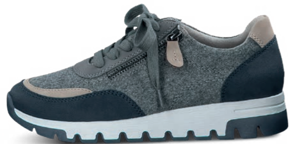
23767-29-220 WIDTH H | RECYCLED P.E.T.