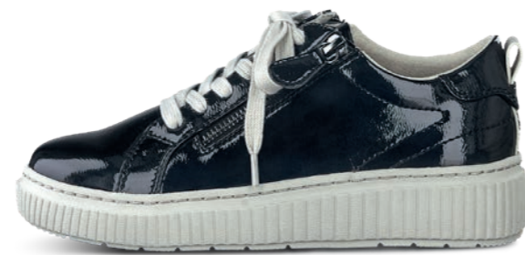
23762-29-844 WIDTH H | RECYCLED P.E.T.