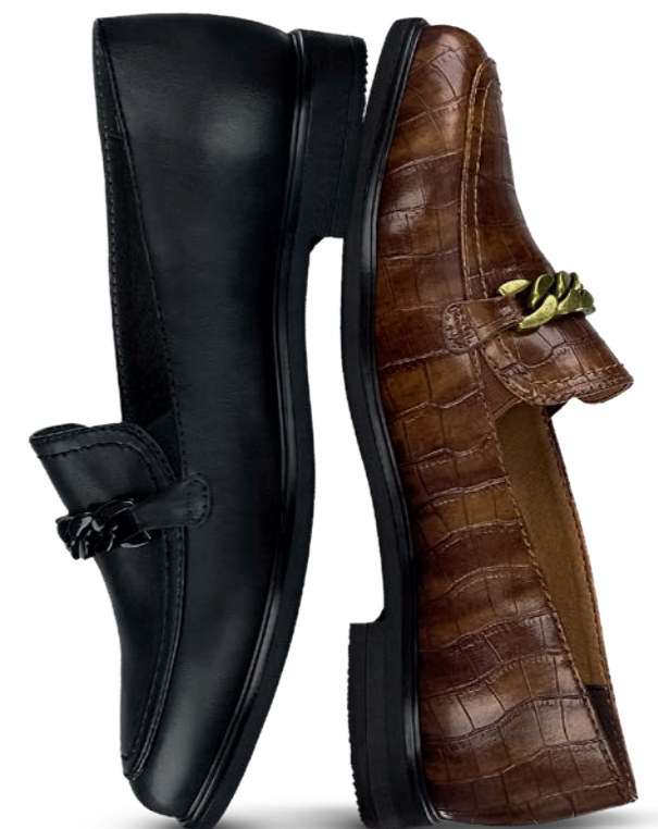
24261-29-001 + 315 WIDTH H | RECYCLED P.E.T.