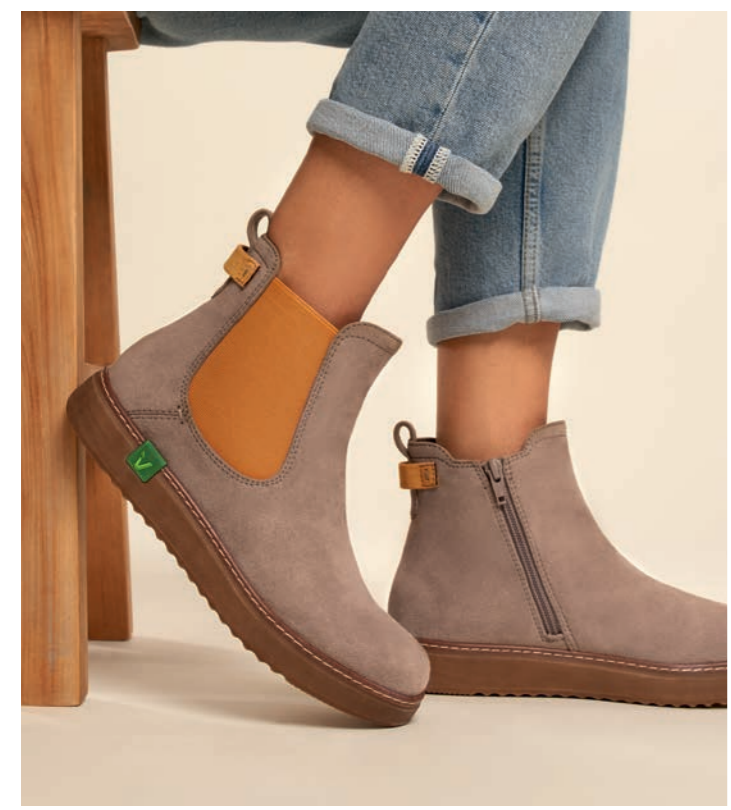
25480-29-268 VEGAN | WIDTH H | RECYCLED P.E.T.