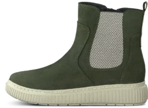
25461-29-707 WIDTH H | RECYCLED P.E.T.