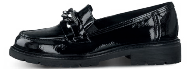
24764-29-018 WIDTH H | RECYCLED P.E.T.