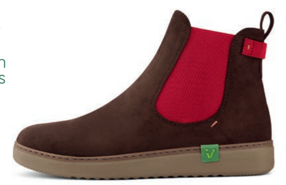
25480-29-359 VEGAN | WIDTH H | RECYCLED P.E.T.