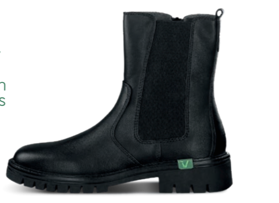
25481-29-001 VEGAN | WIDTH H | RECYCLED P.E.T.