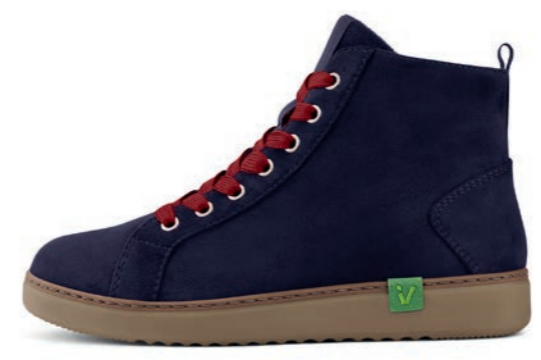
25280-29-889 VEGAN | WIDTH H | RECYCLED P.E.T.