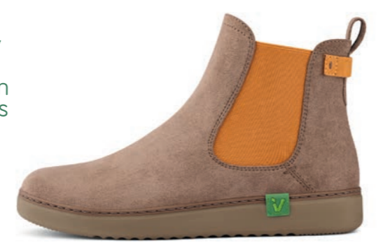
25480-29-268 VEGAN | WIDTH H | RECYCLED P.E.T.