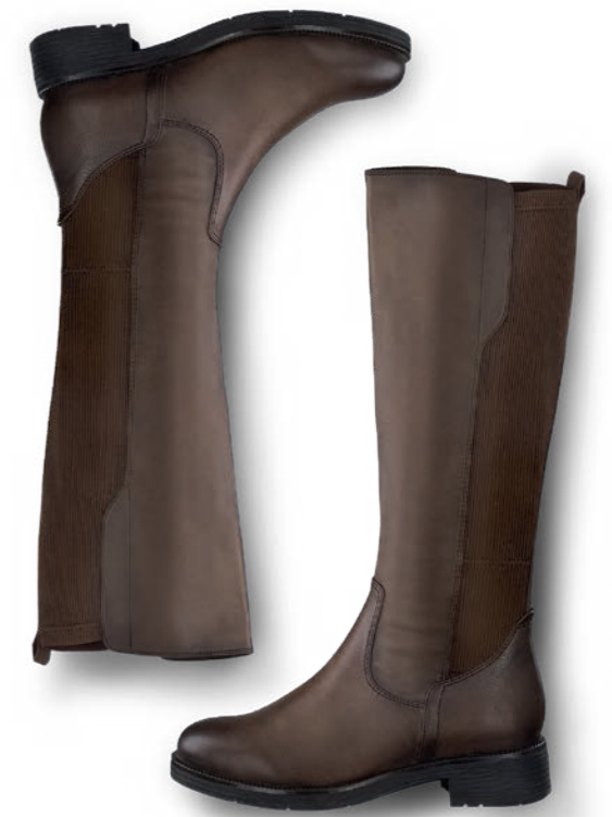
25560-29-361 WIDTH H | RECYCLED P.E.T.