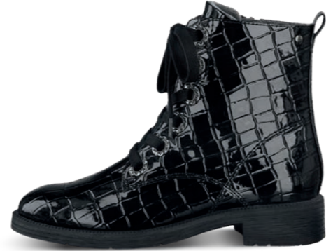
25264-29-091 WIDTH H | RECYCLED P.E.T.