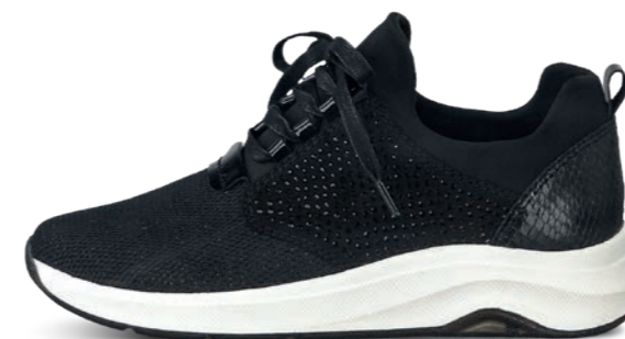
23765-29-007 WIDTH H | RECYCLED P.E.T.