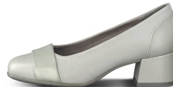
22365-29-411 WIDTH H | RECYCLED P.E.T.