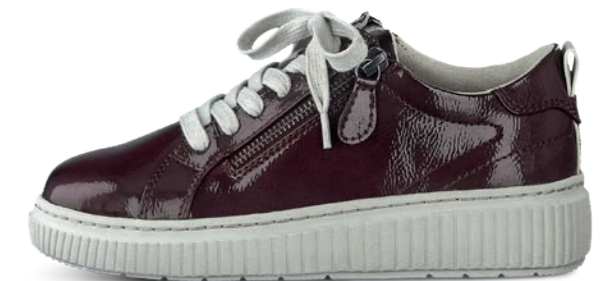
23762-29-586 WIDTH H | RECYCLED P.E.T.