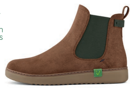
25480-29-377 VEGAN | WIDTH H | RECYCLED P.E.T.