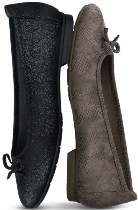
22164-29-096+347 WIDTH H | RECYCLED P.E.T.