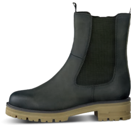
25463-29-707 WIDTH H | RECYCLED P.E.T.