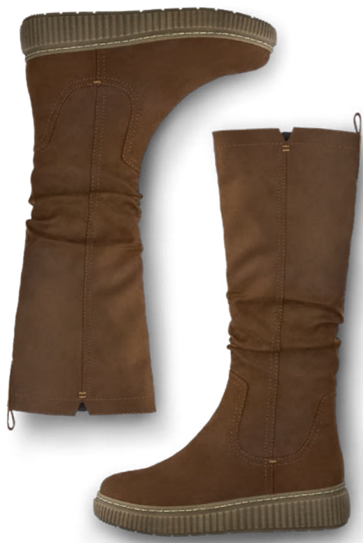
25660-29-305 WIDTH H | RECYCLED P.E.T.