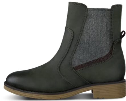
25364-29-707 WIDTH H | RECYCLED P.E.T.