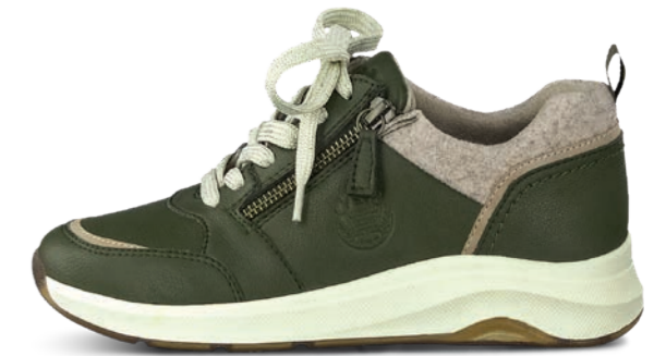
23763-29-707 WIDTH H | RECYCLED P.E.T.