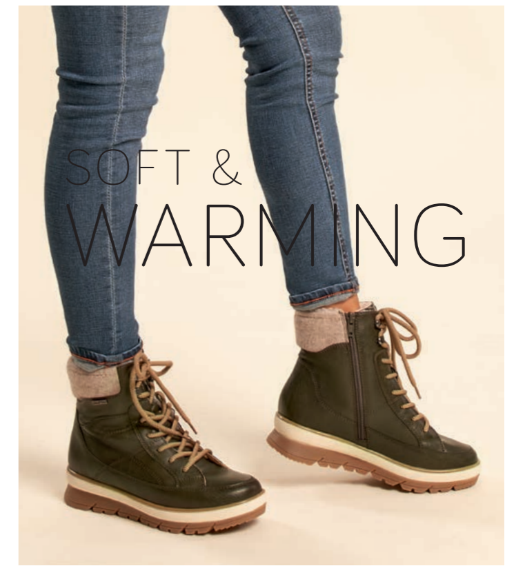
26271-29-707 WIDTH H | RECYCLED P.E.T. | JANA TEX