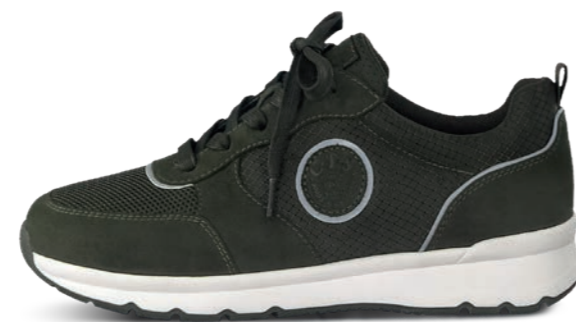
23664-29-707 WIDTH H | RECYCLED P.E.T.