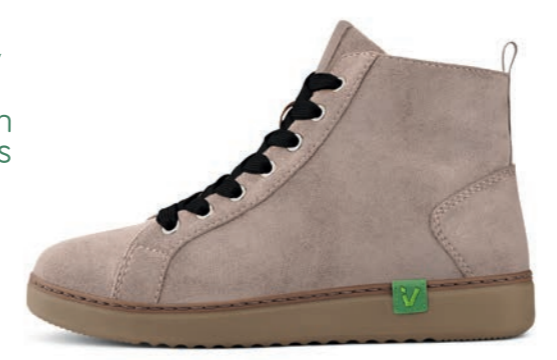
25280-29-309 VEGAN | WIDTH H | RECYCLED P.E.T.