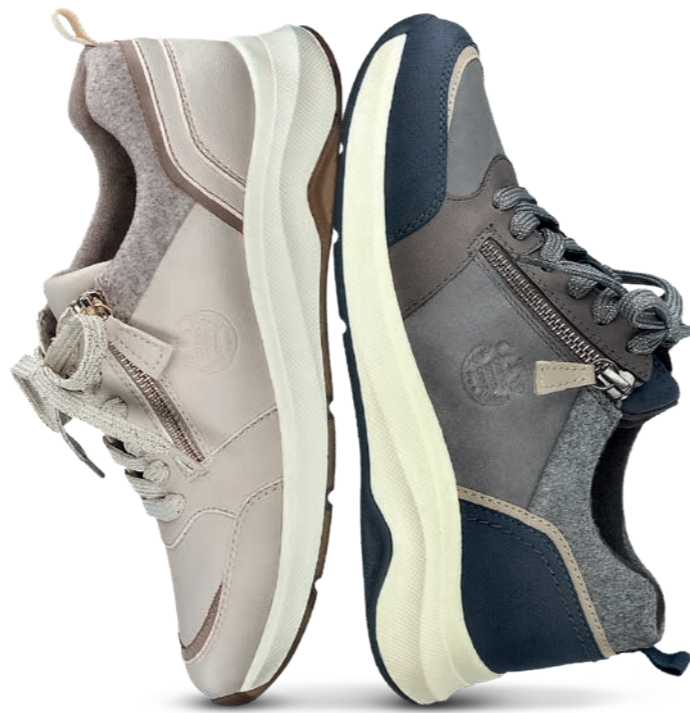
23763-29-411+220 WIDTH H | RECYCLED P.E.T.