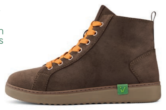
25280-29-769 VEGAN | WIDTH H | RECYCLED P.E.T.