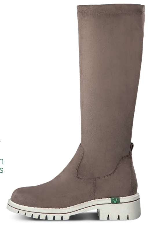
25680-29-231 VEGAN | WIDTH H | RECYCLED P.E.T.