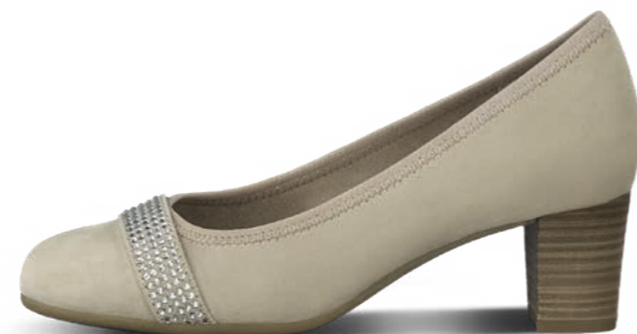
22465-29-341 WIDTH H | RECYCLED P.E.T.