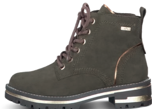
26268-29-707 WIDTH H | RECYCLED P.E.T. | JANA TEX