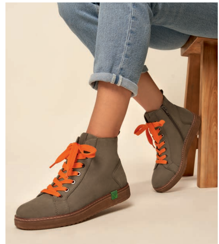
25280-29-269 VEGAN | WIDTH H | RECYCLED P.E.T.