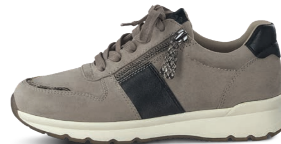
23663-29-231 WIDTH H | RECYCLED P.E.T.