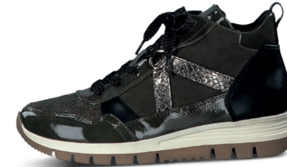
25267-29-707 WIDTH H | RECYCLED P.E.T.