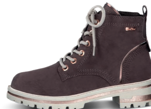
26268-29-598 WIDTH H | RECYCLED P.E.T. | JANA TEX