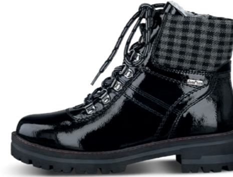
26260-29-018 WIDTH H | RECYCLED P.E.T. | JANA TEX