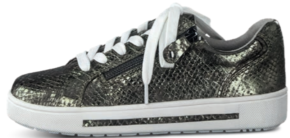
23660-29-295 WIDTH H | RECYCLED P.E.T.