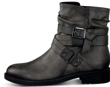
25465-29-206 WIDTH H | RECYCLED P.E.T.