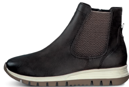
25468-29-304 WIDTH H | RECYCLED P.E.T.