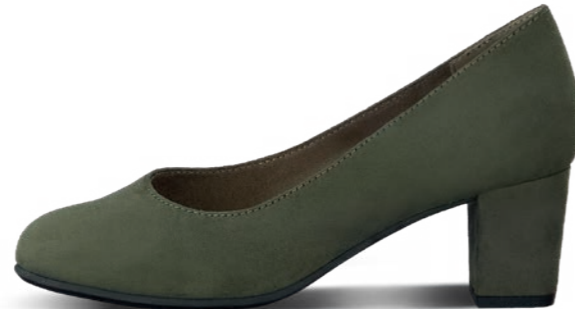
22468-29-707 WIDTH H | RECYCLED P.E.T.