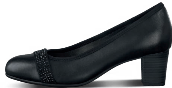
22464-29-001 WIDTH H | RECYCLED P.E.T.