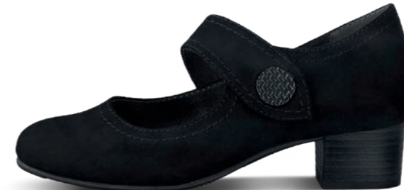
24360-29-001 WIDTH H | RECYCLED P.E.T.