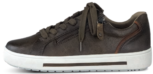
23660-29-304 WIDTH H | RECYCLED P.E.T.