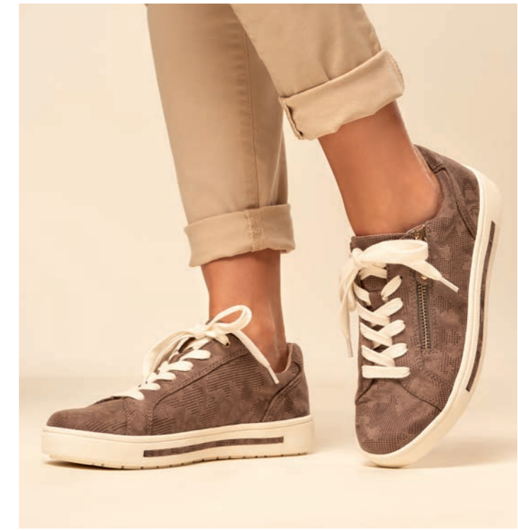
23661-29-347 WIDTH H | RECYCLED P.E.T.