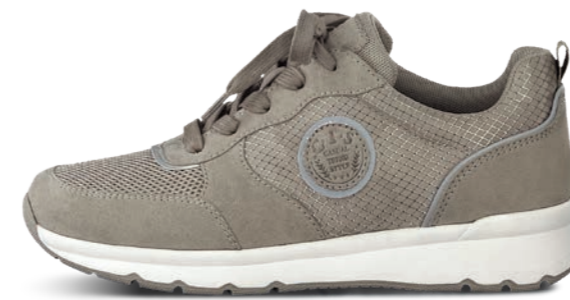
23664-29-231 WIDTH H | RECYCLED P.E.T.