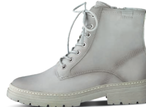
25262-29-204 WIDTH H | RECYCLED P.E.T.