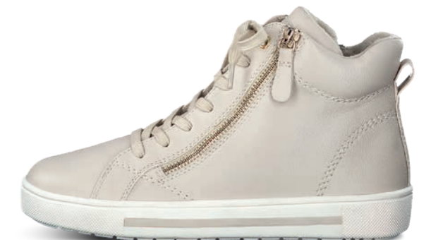
25265-29-411 WIDTH H | RECYCLED P.E.T.