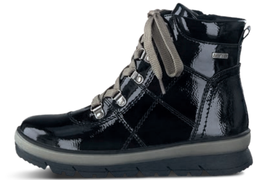
26266-29-001 WIDTH H | RECYCLED P.E.T. | JANA TEX